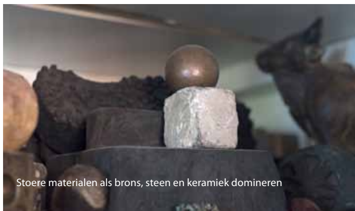
Stoere materialen als brons, steen en keramiek domineren

'Eigenlijk ben ik nog steeds het jongetje dat voor rietstengel speelt'