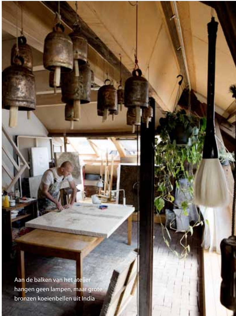
Aan de balken van het atelier hangen geen lampen, maar grote bronzen koeienbellen uit India

'Vroeger legde ik een werk te veel mijn wil op. Nu stel ik me open voor wat het me vertelt'